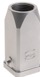
Ref.ª: 19 44 003 1443 Capota com saída rectilínea M20 com junta colada