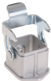
Ref.ª: 19 44 003 0301 Base a embutir