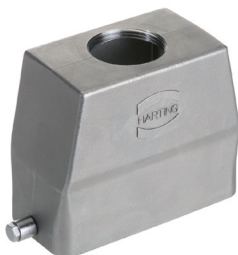
Ref.ª: 19 44 310 0447 Capota com saída rectilínea M32