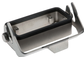
Ref.ª: 19 44 310 0305 Base a embutir