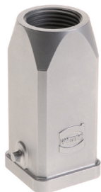
Ref.ª: 19 44 003 1440 Capota com saída rectilínea M20